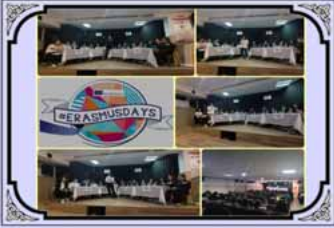
ŞOYAL'de Erasmusdays Etkinlikleri