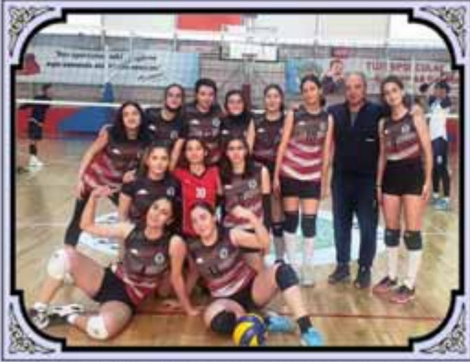
GENÇ KIZLAR VOLEYBOL OKUL TAKIMIMIZ