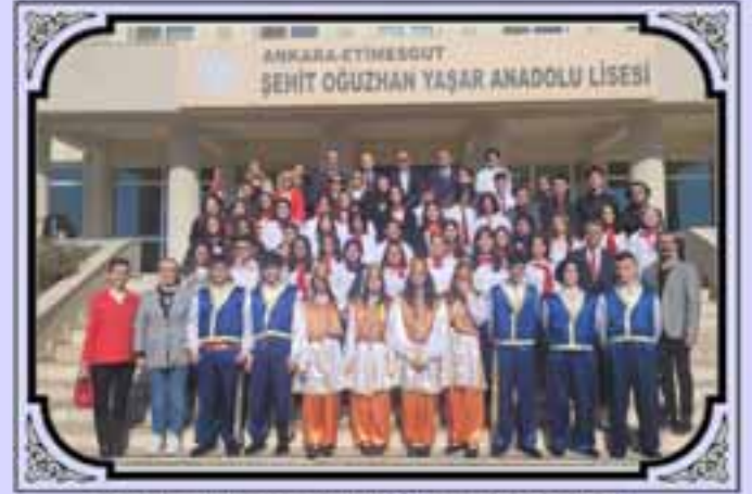
ŞOYAL'DE CUMHURİYET COŞKUSU