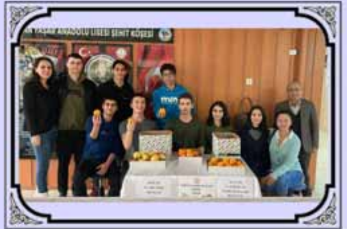
Yerli Malı Haftası Etkinliği