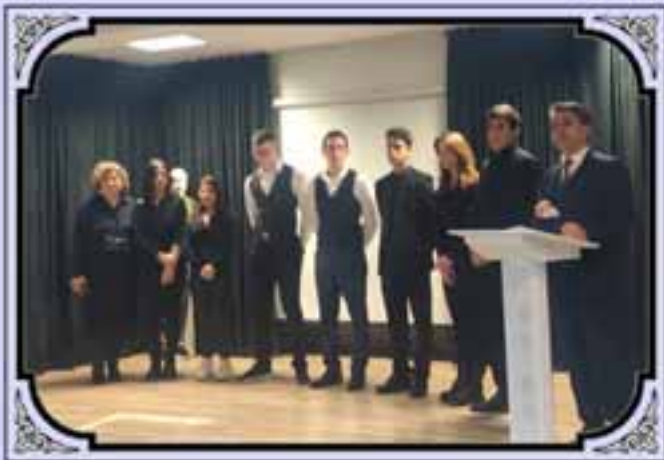
12 Mart Etkinliğimiz