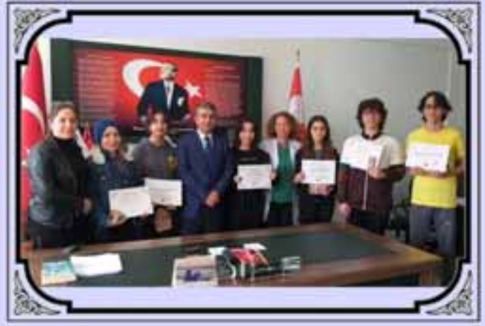
İngilizce Münazara Etkinliğine Katılım