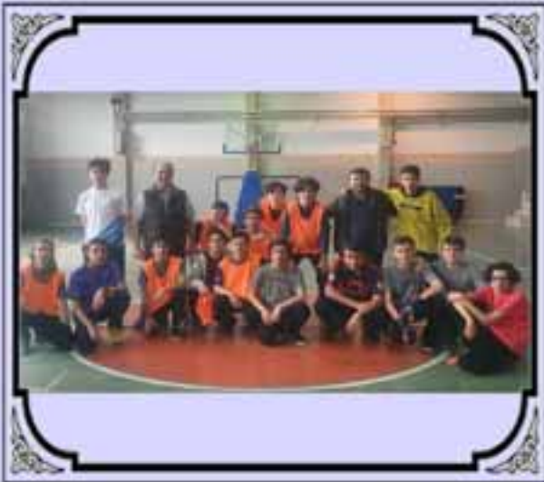
ŞOYAL FUTSAL TURNUVASI'NDAN