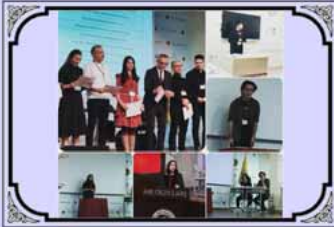
Arı Koleji 5.Münzara Yarışmasına Katılım