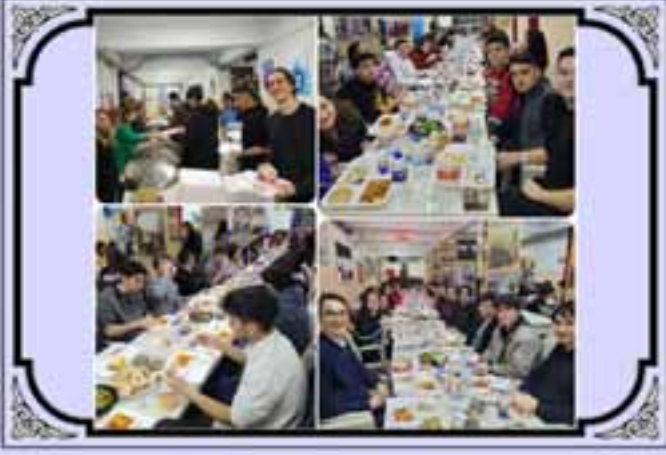
12. Sınıflarla İftar