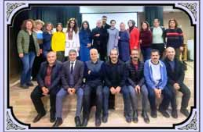
Baskent Öğretmen Atölyeleri "Proje Hazırlama Teknikleri" Semineri