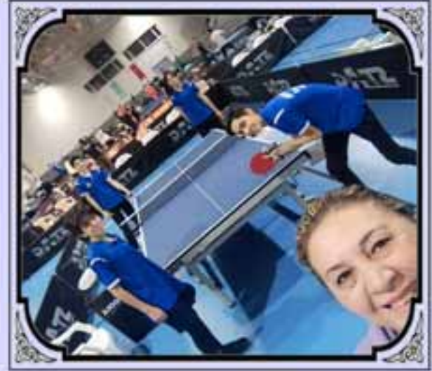
MASA TENİSİ TAKIMIMIZ