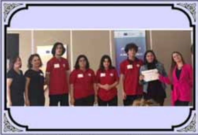
Gençlik Kurultayına Katılım