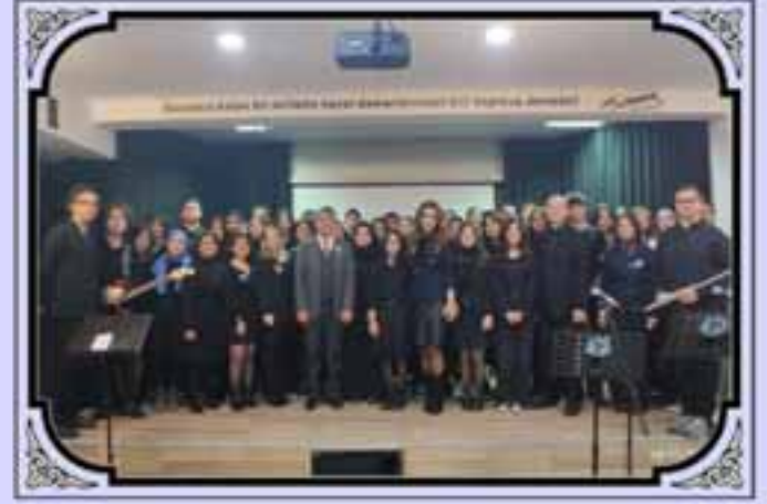
10 Kasım Atatürk'ü Anma Programımız