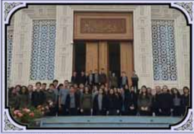
Mevlid- i Nebi Haftası Etkinliklerimiz