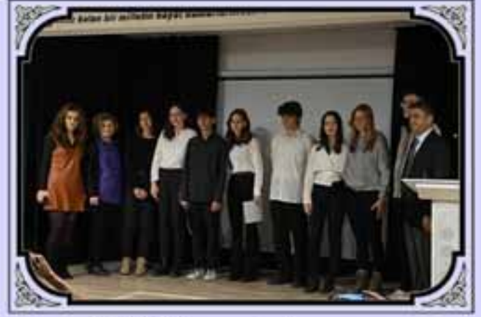
21 Mart Nevruz Kutlamamız