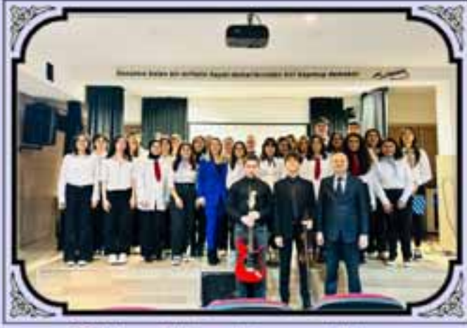
23 Nisan Ulusal Egemenlik ve Çocuk Bayramı Programımız