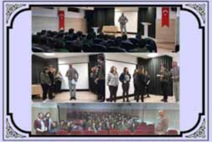
Dünya Tiyatrolar Günü Etkinliğimiz