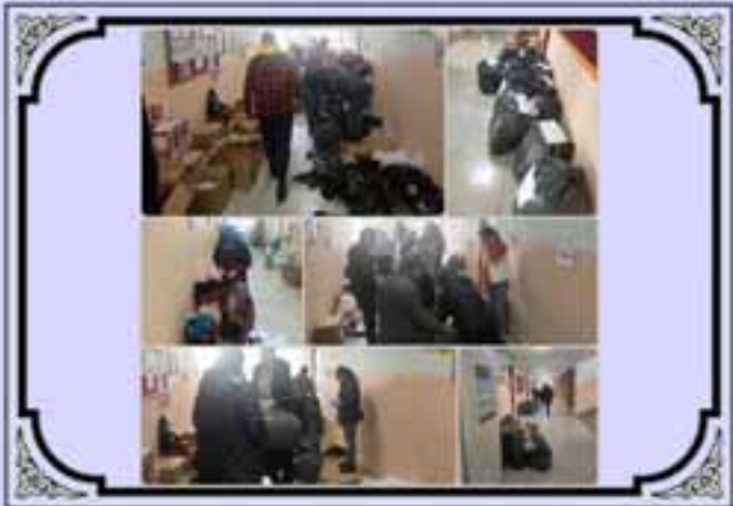
Deprem Bölgesi Yardım Kampanyamız