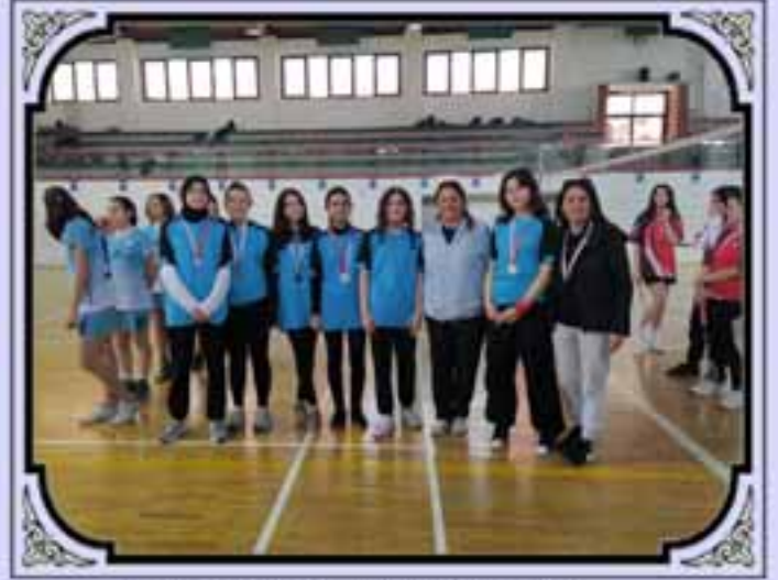
BADMİNTON KIZ TAKIMIMIZ