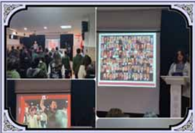
15 Temmuz Demokrasi ve Millî Birlik Günü