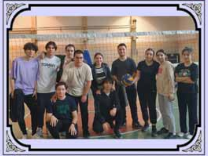
SINIFLAR ARASI VOLEYBOL TURNUVASI BİRİNCİSİ TAKIMIMIZ