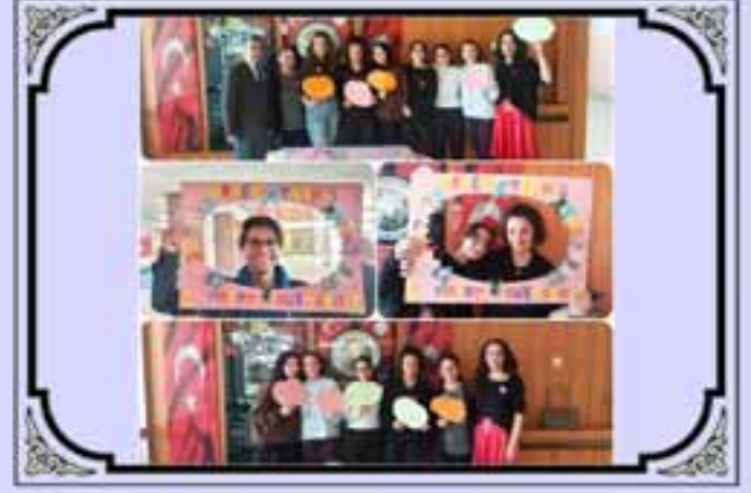
Kanser Haftası Etkinliđi