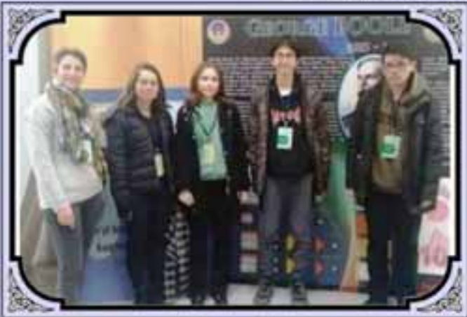
12. GELENEKSEL LİSELER ARASI MATEMATİK YARIŞMASI