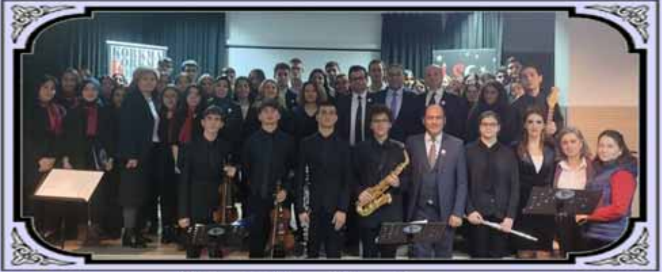
Mehmet Akif Ersoy'u Anma Programımız