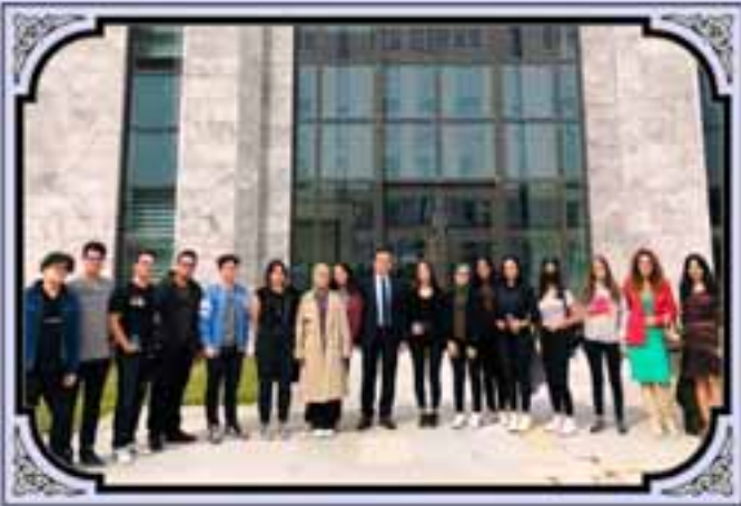
Yargıtay Cumhuriyet Başsavcılığına Ziyaretimiz