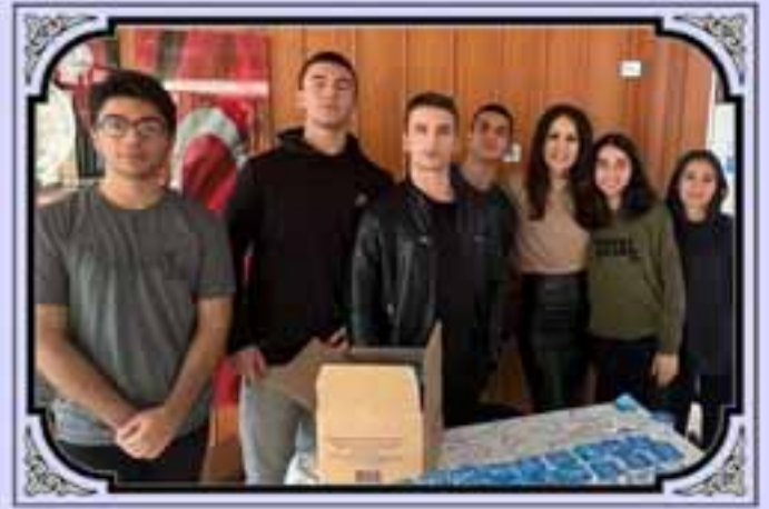
Dünya Böbrek Günü Etkinliği