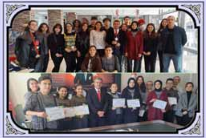
SIFIR ATIK PROJEMİZ