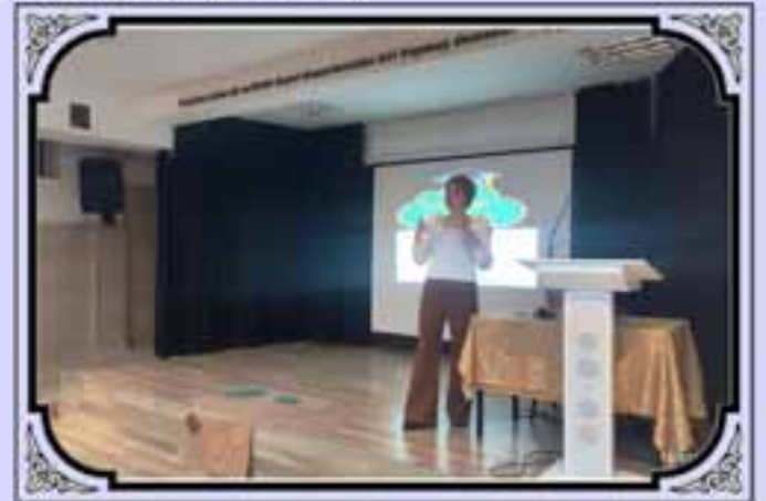
Stres Yönetimi Semineri