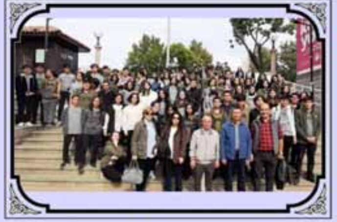
Tacettin Dergahı Gezimiz