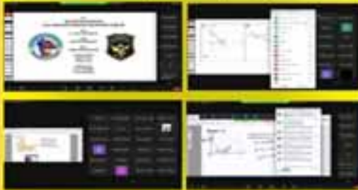
SOYAL Matematik Zümresi

Okul ortaklığı projesi kapsamında ŞOYAL & GÖBAL matematik zümrelerinin planladığı, her iki okulun öğrencilerinin katılımıyla çevrimiçi ders yapıldı.