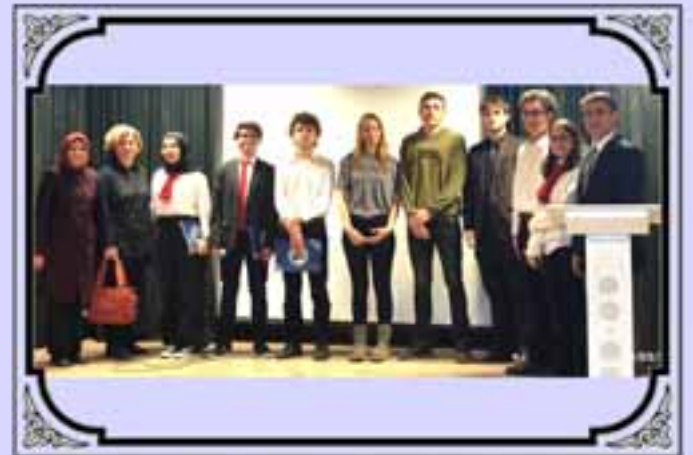
18 MART ÇANAKKALE ZAFERİ PROGRAMIMIZ