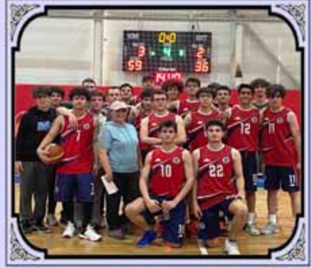
GENÇ ERKEKLER OKUL BASKETBOL TAKIMIMIZ