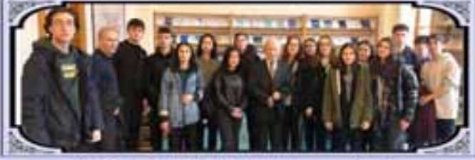
11H Sınıfı ile TBMM Ziyaretimiz