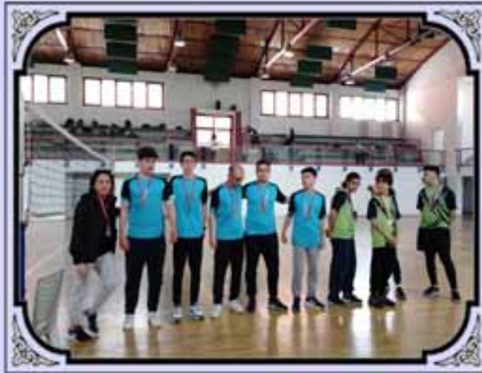
BADMİNTON İLÇE BİRİNCİSİ TAKIMIMIZ