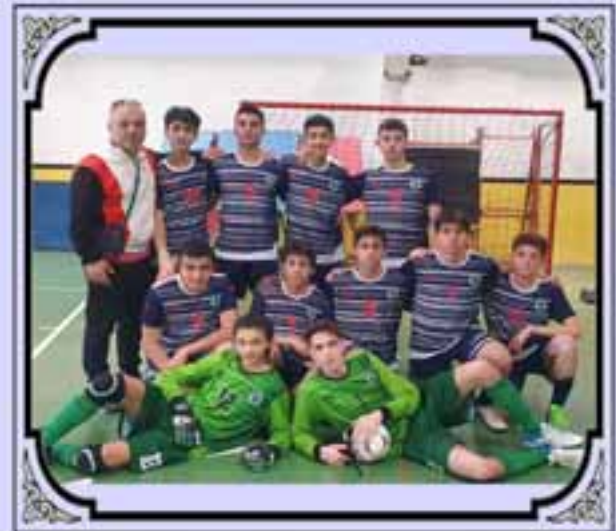
OKUL FUTSAL TAKIMIMIZ